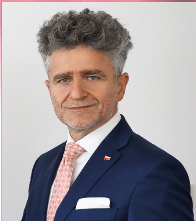
Krzysztof Marek Słoń Senator RP, PIS

Wolną od wroga zewnętrznego, najeźdźcy i okupanta. Wolną od biedy, wyzysku i kajdan ekonomicznych. Od zniewolenia Ducha i przenicowanych na lewą stronę umysłów, toczonych różnymi wirusami. Wolną od nienawiści i podstępny brata przeciw bratu. Wolną od szarpania Białą-Czerwoną, każdy w swoją stronę. Wolną od suszy, zarazy i strachu przed jutrem. Od zwątpienia i obojętności na los słabszego brata. Pobłogosław Panie!