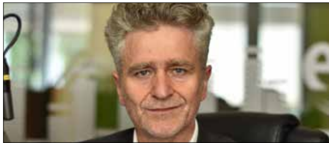
KRZYSZTOF MAREK SŁOŃ Senator RP, PiS

Druhowie i drużyny Ochotniczych Straży Pożarnych stoją ramię w ramię ze strażakami z PSP i bronią naszego bezpieczeństwa. Zapobiegają i likwidują skutki katastrof naturalnych, chronią lasy, łąki oraz dobytek mieszkańców wsi i małych miast. Dlatego rząd Prawa i Sprawiedliwości od 2016 roku konsekwentnie wspomaga nie tylko Państwową Strażą Pożarną, ale też strażaków OSP i wyposaża ich jednostki w niezbędny sprzęt oraz dofinansowuje zakup samochodów ratowniczo-gaśniczych.