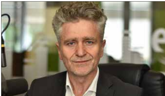
KRZYSZTOF MAREK SŁOŃ Senator RP, PiS

Polska potrzebuje taniego, bezpiecznego źródła energii elektrycznej oraz ciepłej. Atom, a zwłaszcza tzw. mały atom, to droga do uzupełnienia naszych zasobów. Po to modernizujemy polską energetykę, żeby jak najszybciej zapewnić dostęp do takich źródeł energii. Rocznie dzięki jednemu reaktorowi będziemy mogli zaoszczędzić około 100-200 mln euro na emisji CO2. Pilnie potrzebujemy alternatywy i taką alternatywą jest atom. Przez lata nie mogliśmy rozwinąć energetyki atomowej, dlatego nasze bezpieczeństwo opieramy na węglu. Ze względu