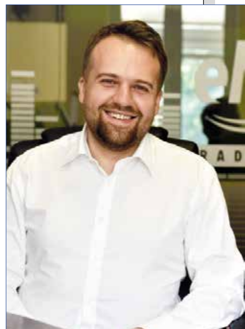
Marek Materek, prezydent Starachowic

Zagospodarowanie terenu wokół Zalewu Lubianka w Starachowicach jest zrealizowane w ramach Projektu „Rewitalizacja – Lepsze życie w Starachowicach, miście, które znalazło pomysły na siebie” (Zadanie 1 – Podniesienie atrakcyjności turystycznej miasta poprzez wykorzystanie potencjału Zalewu Lubianka). Projekt realizowany jest w ramach Regionalnego Programu Operacyjnego Województwa Świętokrzyskiego na lata 2014–2020, współfinansowany ze środków Unii Europejskiej. Koszt inwestycji: 30 milionów złotych.