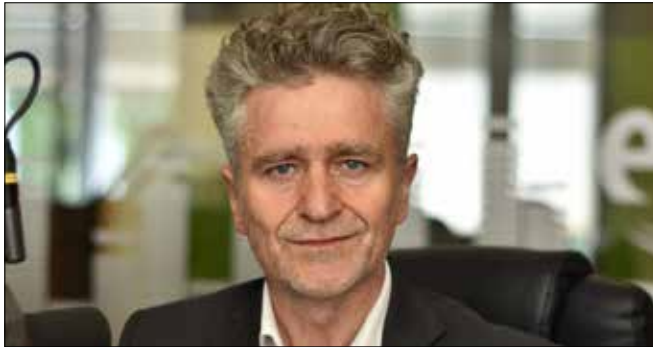
KRYSZTOF MAREK SŁOŃ Senator RP, PiS

Przez setki polskich miast przeszły w ostatnich tygodniach Marsze dla Życia i Rodziny. Tysiące Polaków pokazało swoje przywiązanie do tych uniwersalnych wartości. Uważam, że to właśnie szacunek dla nich stanowi fundament naprawdę demokratycznego społeczeństwa. Co ważne, wszystkie te marsze miały bardzo pokojowy charakter i spokojny przebieg. Nie było rozdźwięku między głoszonymi hasłami, a zachowaniem uczestników. Obyło się bez słów nienawiści, nawet w stosunku do tych co promują aborcję, eutanazję czy wolność seksualną.