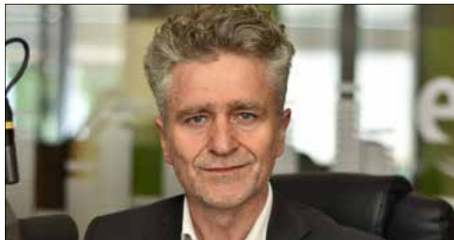
KRYSZTOF MAREK SŁOMKA Senator RP, PiS

Opozycja próbuje wmówić Polakom, że nasze państwo jest w ruinie, że na wszystko brakuje pieniędzy, że jest źle zarządzane. A my, jakby na przekór tym głosom, przedstawiamy dobry i stabilny budżet 2024, który w poczuciu odpowiedzialności chcemy zrealizować. Udowodniłmy, że umiemy to robić.