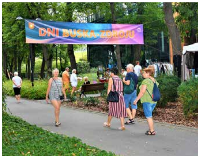
autor: Iwona Gajewska-Wrona

Za nami Dni Buska, czyli jedna z największych imprez w regionie świętokrzyskim. Przez dwa dni: 26 oraz 27 sierpnia centrum miasta było prawdziwym rajem dla dzieci dorosłych.