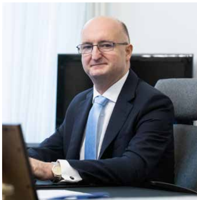
prof. Piotr Wawrzyk Poseł Ziemi Świętokrzyskiej

Chrześcijananie to obecnie najbardziej prześladowana grupa religijna na świecie. O tym, w kontekście trwającej wystawy o męczennikach z Peru – bł. Michale Tomaszku i bł. Zbigniewie Strzałkowskim mówi prof. Piotr Wawrzyk, sekretarz stanu w Ministerstwie Spraw Zagranicznych