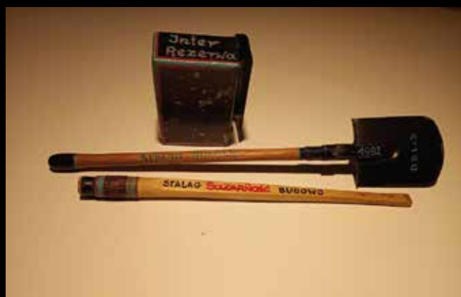
Pamiątki z Wojskowego Obozu Internowania w Budowie. Fotografie w zbiorach Jana Gwizdaka.

higieny służyła im umieszczona na zewnątrz rynna z zamarzającą w kranie wodą. W obozach w Budowie, Czarnem oraz Głogowie przybyłym mężczyznom golono włosy. Na ogół przez pierwsze tygodnie rezerwiści byli odcięci od kontaktu z rodzinami i światem zewnętrznym. Poddawano ich przesłuchaniom, rewizjom i innym szykanom. W Budowie przez cały okres pobytu obowiązywał zakaz odwiedzin bliskich i otrzymywania korespondencji. Rezerwiści byli też zmuszani do ciężkiej fizycznej pracy, która niejednokrotnie nie miała żadnego sensu i w odczuciu osób ją wykonujących poniżała ich. Było to np. kopanie i zasypywanie dołów, przrzucanie śniegu itp. W WOI nasilono indoktrynację polityczną, prowadzoną przez wojskowy aparat polityczno-wychowawczy. Rezerwistów nakłaniano do współpracy ze służbami wojskowymi. Prowadzono intensywne działania mające na celu pozyskanie osobowych źródeł informacji spośród wcielonych i nawiązanie kontaktu z źródłami informacji, które uprzednio współpracowały z SB.