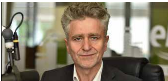
KRZYSZTOF MAREK SŁOŃ Senator RP, PiS

Dziś, zamiast felietonu, proponuję chwilę refleksji nad wybranymi przez mnie cytatami Ojców Niepodległości naszej Ojczyzny: