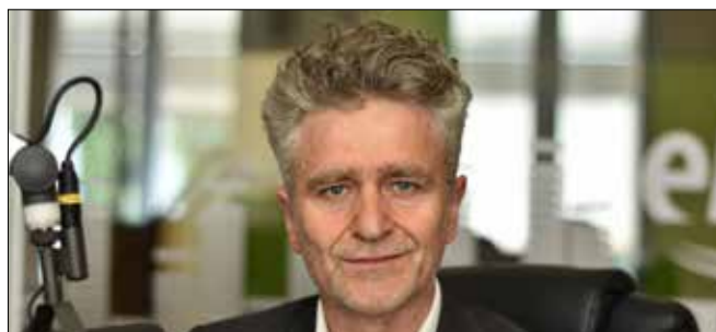
KRZYSZTOF MAREK SŁOŃ Senator RP, PiS

Stało się! Parlament Europejski otworzył puszkę Pandory, przyjmując w głosowaniu propozycję 267 zmian w traktatach: o Unii Europejskiej oraz o Funkcjonowaniu Unii Europejskiej, w tym zmianę kluczową, czyli rezygnację z zasady jednomyślności w głosowaniach w Radzie UE w 65 obszarach i przeniesienie kompetencji z poziomu państw członkowskich na poziom UE. Po analizie wyników głosowania (291 głosów za, 274 przeciw, 44 wstrzymujące się) widać, że zaważyło dziewięć głosów „za”, oddanych przez grupę „naszych” europosłów wybranych z list Koalicji Obywatelskiej i Lewicy.