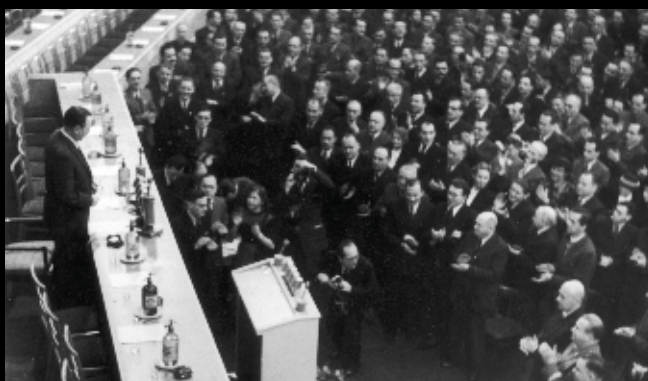
Przemówienie Bolesława Bieruta

w województwie kieleckim, zostali zmarginalizowani w władzach kół partyjnych, komitetów gminnych, miejskich i powiatowych. Prym wiodli niegdysiejsi pepeerowcy.