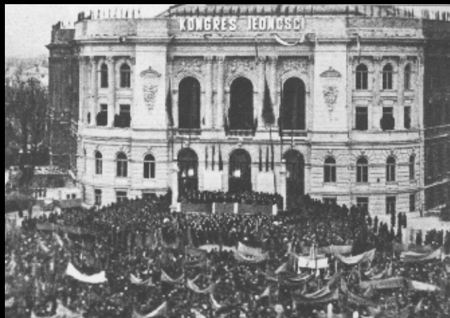
Wiec przed budynkiem Politechniki Warszawskiej, grudzień 1948 r.

Do początków lutego 1949 r. trwała „akcja scaleniowa”, polegająca na łączeniu kół PPS i PPR. Jedynie w kilku miejscowościach doszło do zgrzytu, gdy nieliczni członkowie partii odmawiali ponownego wypełnienia kwestionariusza, obawiając się, że będzie to równoznaczne z deklaracją przystąpienia do spółdzielni produkcyjnej. Mimo że byli członkowie PPS stanowili około 1/3 przynależnych do PZPR