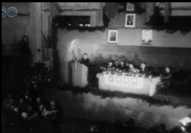
Wiec przedkongresowy w Hucie Ostrowiec, podczas którego przyjęto rezolucję ws. tzw. czynu kongresowego, PKF 46_48, Repozytorium Cyfrowe Filmoteki Narodowej

Już od pierwszych dni grudnia 1948 r. w większych miastach województwa odbywały się uroczystości na cześć zbliżającego się kongresu, zebrania członków związków zawodowych, masówki fabryczne. Przez województwo przebiegły młodzieżowe sztafety „Gwiazdzistego Biegu”, niosącego „pозdrowienia na Kongres”, zapoczątkowane w Rzeszowie i Katowicach. Na niesionym przez uczestników sztafety pergaminie pojawiały się pieczętki i podpisy przedstawicieli zakładów znajdujących się na trasie biegu. W niedzielę 12 grudnia w miejscowościach gminnych zorganizowano okolicznościowe akademie dla mieszkańców wsi.