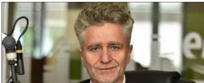
KRZYSZTOF MAREK SŁOŃ Senator RP, PiS