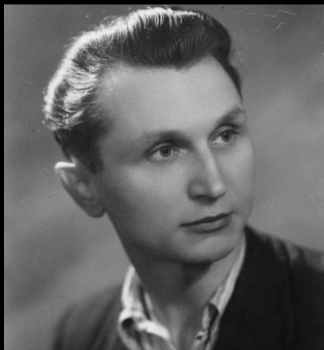
Stanisław Sojczyński „Warszyc”

Wszystkich ich Polska straciła, ponieważ swoim czynem, wolą i oddaniem służyli Ojczyźnie wolnej i niepodległej. Trafili do bezimiennych dołów w lasach i zakątkach cmentarzy. Na terenie Kwatery Ł na warszawskich Powązkach, w miejscu ukrycia ciał przeciwników narzuconej władzy, pochowano funkcjonariuszy odpowiedzialnej za to partii politycznej. Mieli zostać zapomniani. Jednak poszukiwanie i godne uhonorowanie osób, które oddały życie w walce o niepodległość kraju i wolność jego obywateli, stanowi obowiązek każdego państwa dbającego o swoją historię, zachowanie narodowej tradycji i kształtowanie postaw patriotycznych. Skazani na zapomnienie i wieczną hańbę odzyskują należne im miejsce w zbiorowej świadomości. 70. rocznica śmierci gen. Augusta Emila Fieldorfa „Nila” w więzieniu na warszawskim Mokotowie minęła 24 lutego 2023 r.