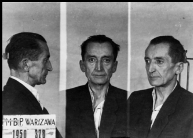
August Emil Fieldorf „Nil”

wolności. Chociaż z zawodu był nauczycielem, to swoje życie związał z wojskiem, kiedy jako siedemnastolatek wstąpił do Związku Strzeleckiego. Walczył w pierwszej wojnie w szeregach Legionów Polskich i rozbrajał Austriaków w Krakowie jesienią 1918 r. Brał udział w walkach na froncie wojny polsko-ukraińskiej, a następnie w wojnie polsko-bolszewickiej. Przez cały