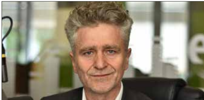
KRZYSZTOF MAREK SŁOŃ Senator RP, PiS

Naszym priorytetem jest tworzenie rozwiązań dających prawo do godnego i niezależnego życia osób z niepełnosprawnościami. Proponujemy wprowadzenie od 1 stycznia 2024 r. nowego rodzaju świadczenia wspierającego. Najważniejsze jego założenia to: