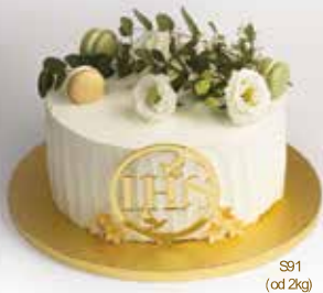
S91 (od 2kg)