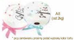
A8 (od 2kg)

* przy zamówieniu prosimy podać wybrany kolor tortu