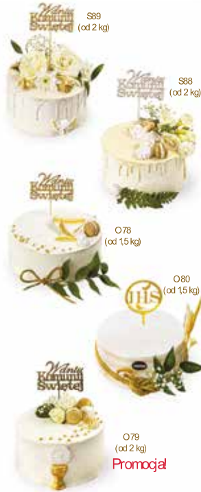
S99 (od 2 kg)