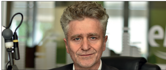
KRZYSZTOF MAREK SŁŃ Senator RP, PiS

Takie właśnie rozwinięcie skrótu CPK cisnie mi się od kilku miesięcy na myśl, choć w powszechnej świadomości Polaków skrót oznacza Centralny Port Komunikacyjny. Skąd zatem moje wątpliwości i pytanie w tytule?