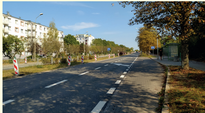
ul. Bohaterów Warszawy

Planowana jest wymiana nawierzchni na jeszcze dwóch kolejnych ulicach. Ogłoszono już przetargi w celu wyłonienia wykonawcy robót. Chodzi o aleję Szajnowicza – Iwanowa na odcinku od rejonu skrzyżowania z ul. Massalskiego do ronda im. J. Zientarskiego oraz na ul. Lecha na kieleckim Czarnowie. Obie modernizację mają się rozpocząć i zakończyć jeszcze w tym roku.