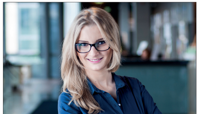
autor: Michal Łosiak