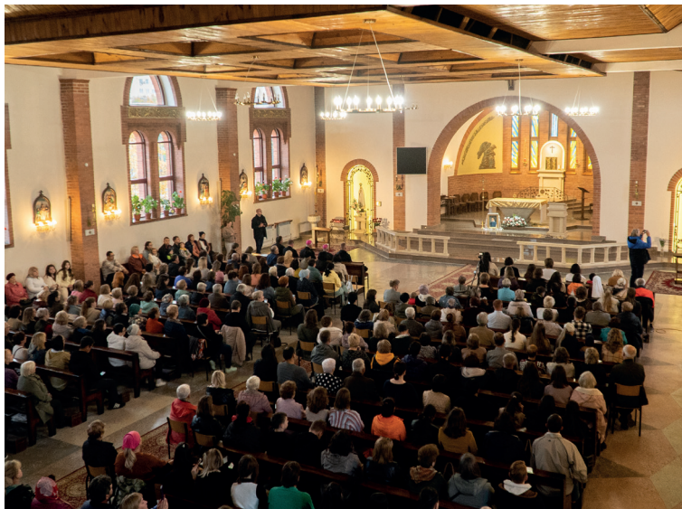
Uroczysta Msza Święta 25-lecia konsekracji kościoła św. Antoniego w kazachskiej Kokczetawie.