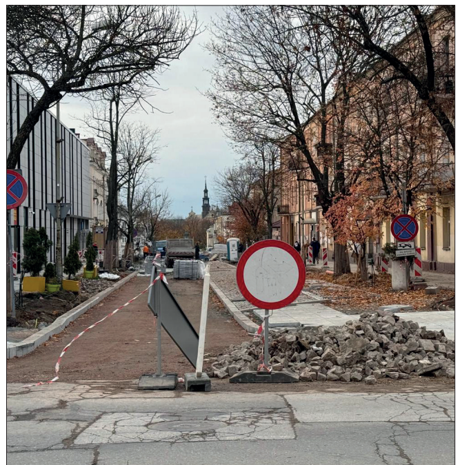
autor: Michał Kita

remoncie zyska ona nową nawierzchnię z kostki brukowej. Jezdnia zostanie zwężona, pojawią się miejsca postojowe dla samochodów. ◀