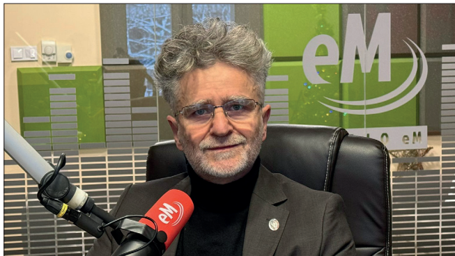
KRYSZTOF MAREK SŁOŃ Senator RP, PiS

Był czas, że dzięki popularnej serii filmowej do określenia tego co dzieje się wokół nas używaliśmy określenia matrix albo rzeczywistość równoległa, a o ludziach oderwanych od kalendarza i codzienności - że żyją w takim właśnie odrealnionym świecie. Od kilku lat do naszej świadomości i do współczesnej polszczyzny wchodzi przebojem przedrostek neo czyli - tłumacząc z greckiego - nowy.