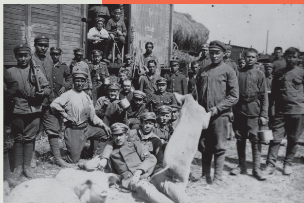
Załoga pociągu pancernego „Śmiały-Szeroki”.