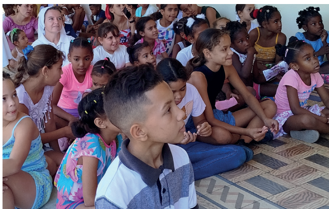
S. Anna z dziećmi w czasie zajęć.