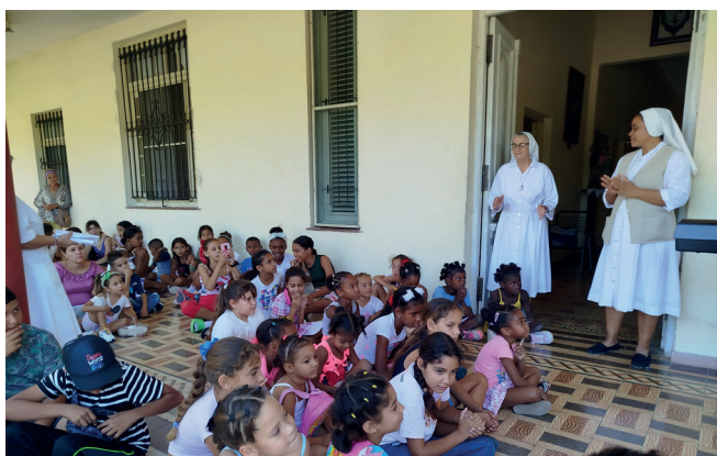
Edukacyjna posługa sióstr w ośrodku na Hawanie.