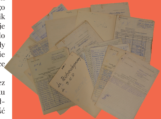
Deklaracje przystąpienia do struktur NSZZ „Solidarność” działających w Hucie im. Marcelego Nowotki w Ostrowcu Świętokrzyskim.