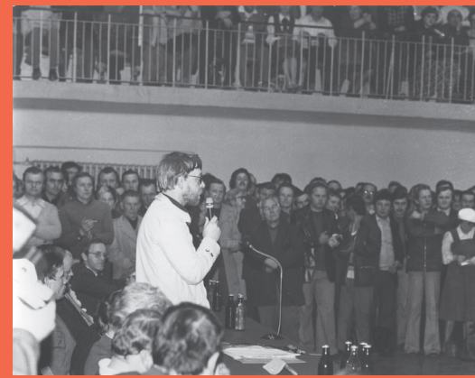
– Wiec NSZZ „Solidarność” zorganizowany w hali Klubu Sportowego Zakładów Ostrowieckich w Ostrowcu Świętokrzyskim, 23 X 1980 r.

Dziś są przydatne nie tylko w działalności edukacyjnej i naukowej prowadzonej przez Instytut. Stanowią również świadectwo potwierdzające przynależność do związku i prowadzenie działalności niepodległościowej przez byłych pracowników Huty. Dopełnieniem zbioru są liczne plakaty i druki ulotne dokumentujące piękną niecodzienność okresu legalnej „Solidarności” oraz wydawnictwa – opracowania i prasa związkowa. W 45. urodziny Panny „S” zachęcamy do poznawania historii Związku oraz losów ludzi świętokrzyskiej „Solidarności”. Godnie dziedziczymy wartości, o które z takim zaangażowaniem upominali się nasi Przodkowie.