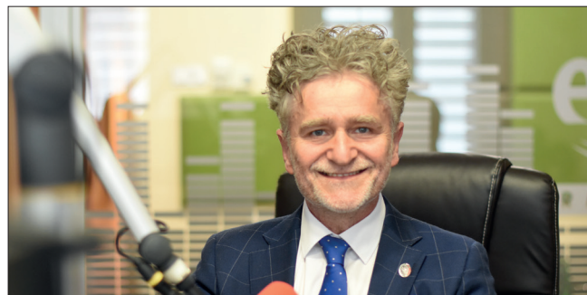
KRZYSZTOF MAREK SŁOŃ Senator RP

Doczekaliśmy się też przez te lata kilku małżeństw naszych wolontariuszy. Dla mnie turnusy to zawsze totalna zmiana tego, co robię na co dzień – odskocznia. I chociaż nie jest łatwo być opiekunem, to nie wyobrażam sobie, żeby inaczej spędzać urlop. Nie przeszkadza mi to, czy pełnię taką, czy inną funkcję. Żeby czuć się spełnionym, nie muszę wcale zwiedzać całego świata czy jeździć do ciepłych krajów – wystarczy, że komuś potrzebującemu wsparcia pomogę zobaczyć piękno tego świata, doświadczyć ludzkiej życzliwości i pełni życia we wspólnocie dobrych ludzi. Takie uczucia towarzyszyły mi też 30 lat temu w Pińczowie, nad zalewem, na turnusie, gdy postanowiłem założyć stowarzyszenie „Niepełnosprawni Plus”.